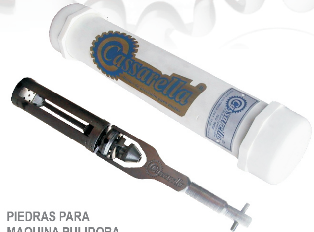
PIEDRAS PARA MAQUINA PULIDORA